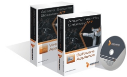
Astaro Software & Virtual Appliances