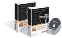
Astaro Software & Virtual Appliances