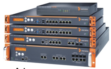
Astaro Hardware Appliances